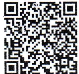
ดาวนโหลดเอกสาร