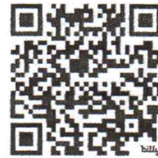
เอกสารประกอบการรับสมัครอบรม