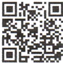
สมัครอบรม