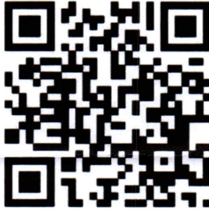
QR code สำหรับลงทะเบียน