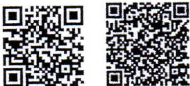
ลงทะเบียนเข้าร่วมประชุม สมัครเข้าฝึกอบรม

จึงเรียนมาเพื่อโปรดพิจารณาประชาสัมพันธ์ และอนุมัติให้บุคลากรในสังกัดที่สนใจเข้าร่วมประชุม วิชาการและฝึกอบรมในครั้งนี้ จักเป็นพระคุณยิ่ง