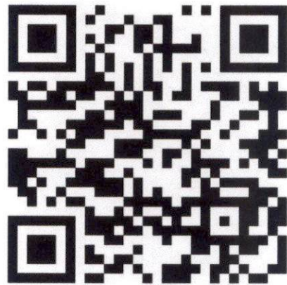
แนวทางการส่งผลงาน