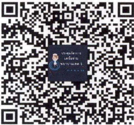
QR Code ลงทะเบียนเข้าร่วมประชุม