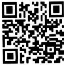
ส่งผลงานวิชาการ