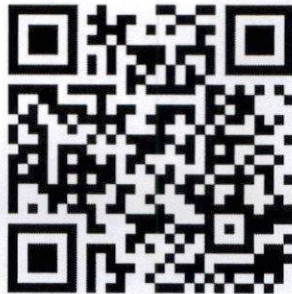
QR code สำหรับลงทะเบียน