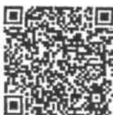
แบบรายงานผลงานR2R

จึงเรียนมาเพื่อโปรดทราบและแจ้งผู้เกี่ยวข้องดำเนินการต่อไปด้วย จะเป็นพระคุณ