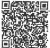
แบบรายงานผลงานR2R

จึงเรียนมาเพื่อโปรดทราบและแจ้งผู้เกี่ยวข้องดำเนินการต่อไปด้วย จะเป็นพระคุณ