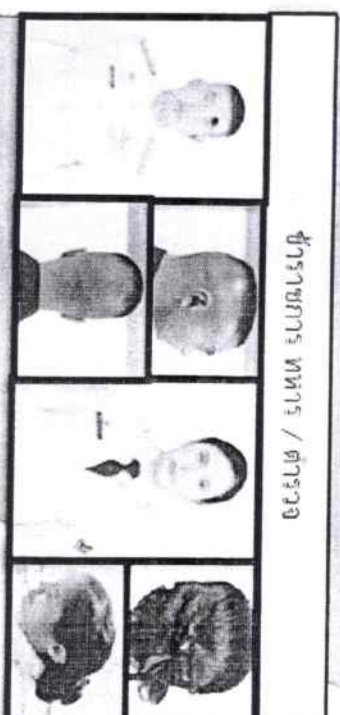
ข้าราชการ ทหาร / ตำรวจ