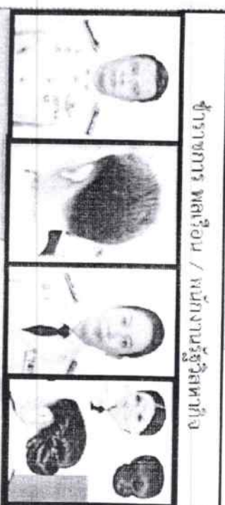
ข้าราชการ พลเรือน / พนักงานรัฐวิสาหกิจ