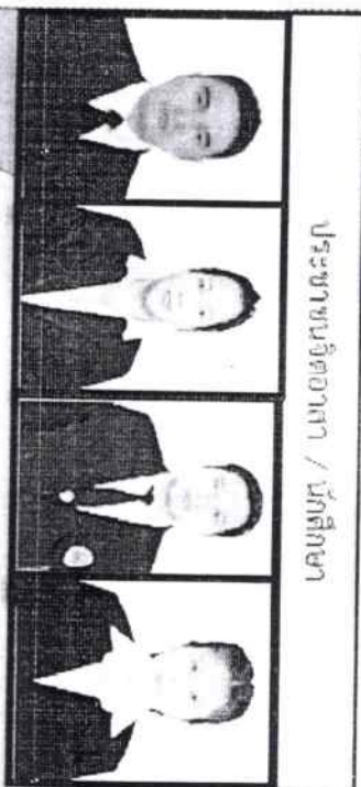
ประชาชนจิตอาสา / นักศึกษา