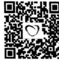
สมัครสอบออนไลน์