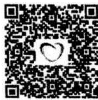
QR Code หนังสือรับรอง