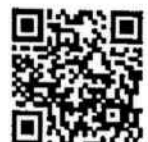
QR-Code เพื่อจองห้องพัก

โทรศัพท์: ๐๒-๔๒๒-๙๒๒๒ E-mail : rsvn@royalriverhotel.com