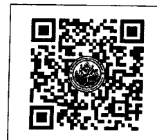
QR-Code เว็บไซต์

โทรศัพท์ ๐-๒๑๐๕-๕๖๘๖ ต่อ ๑๐๐๒๖๖ โทรสาร ๐-๒๔๓๓-๔๙๓๘