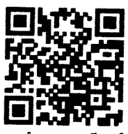
แบบสำรวจความพึงพอใจ วารสาร AMJAM

Amjam (นายจิรายุทธ สัตย์สม) นักทรัพยากรบุคคล - 7 มี.ค. 2565