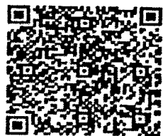
QR Code แบบใบสมัครขอโอน

สำนักงานเลขาธิการกรม โทร. ๐ ๒๕๕๐ ๒๖๑๕ โทรสาร ๐ ๒๑๔๙ ๕๖๕๙