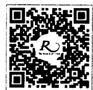
QR CODE สำหรับจองห้องพัก มหาวิทยาลัยศิลปากร