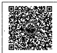
QR-Code เพื่อสมัครอบรม

สำนักงานบริการวิชาการ มหาวิทยาลัยศิลปากร (ตลิ่งชัน) โทรศัพท์ ๐-๒๑๐๕-๔๖๘๖ ต่อ ๑๐๐๒๖๖ โทรสาร ๐-๒๔๓๓-๔๙๓๘