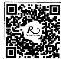
QR CODE สำหรับจองห้องพัก มหาวิทยาลัยศิลปากร

การสำรองห้องพัก ท่านสามารถจองห้องพักกับทางโรงแรมโดยสแกน QR-Code สำหรับจองห้องพัก หากท่านจองห้องพักภายหลังห้องพักอาจเต็มได้ และอาจจะไม่ได้ห้องพักราคาพิเศษซึ่งเป็นอัตราค่าที่พัก โรงแรมรอยัลริเวอร์ ๒๑๙ ซอยจรัญสนิทวงศ์ ๖๖/๑ แขวงบางพลัด เขตบางพลัด กรุงเทพฯ ๑๐๗๐๐ โทรศัพท์: ๐๒-๔๒๒-๙๒๒๒ โทรสาร : ๐๒-๔๓๓-๕๘๘๐ E-mail : rsvn@royalriverhotel.com