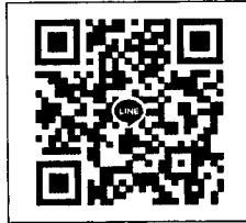
QR-Code เพื่อสอบถามข้อมูล