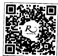
QR CODE สำหรับจองห้องพัก มหาวิทยาลัยศิลปากร