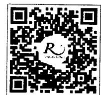
QR CODE สำหรับจองห้องพัก มหาวิทยาลัยศิลปากร

โทรศัพท์: ๐๒-๔๒๒-๙๒๒๒ โทรสาร : ๐๒-๔๓๓-๕๘๘๐ E-mail : rsvn@royalriverhotel.com