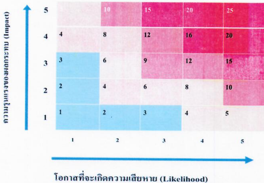
ตารางระดับของความเสี่ยง (Degree of Risk)