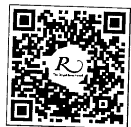
QR CODE สำหรับจองห้องพัก มหาวิทยาลัยศิลปากร