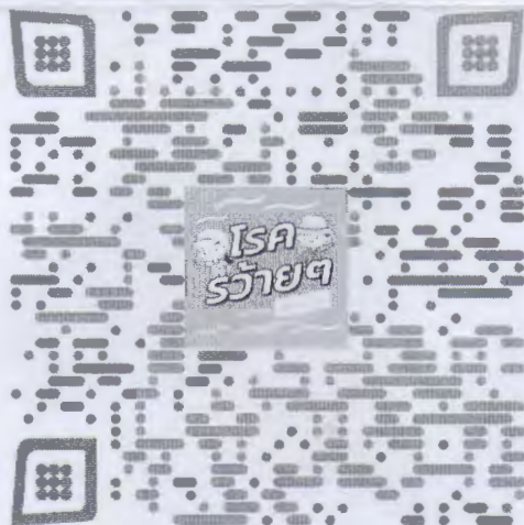
QR code เภจโรคร้าย ๆ วัยทำงาน